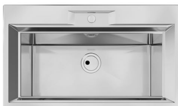
Fregadero FL 2975 060